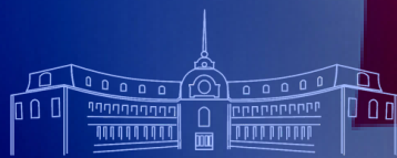
აჭარის ავტონომიური რესპუბლიკის უმაღლესი საბჭო