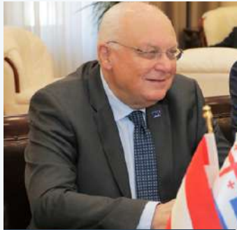
დოქტორი ფრანც შაუსტერგერი IRE პრეზიდენტი