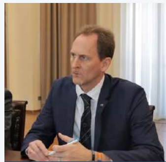
დოქტორი იოაჰიმ ფრიც გენერალური მდივანი